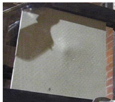
<テストピース 裏側>