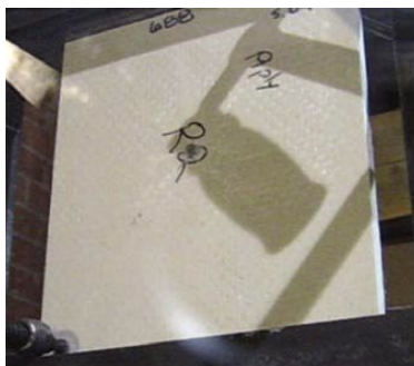
<テストピース 表側>